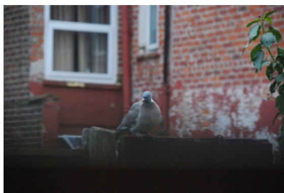
George, the pigeon that lost his message. Petra Počanić.