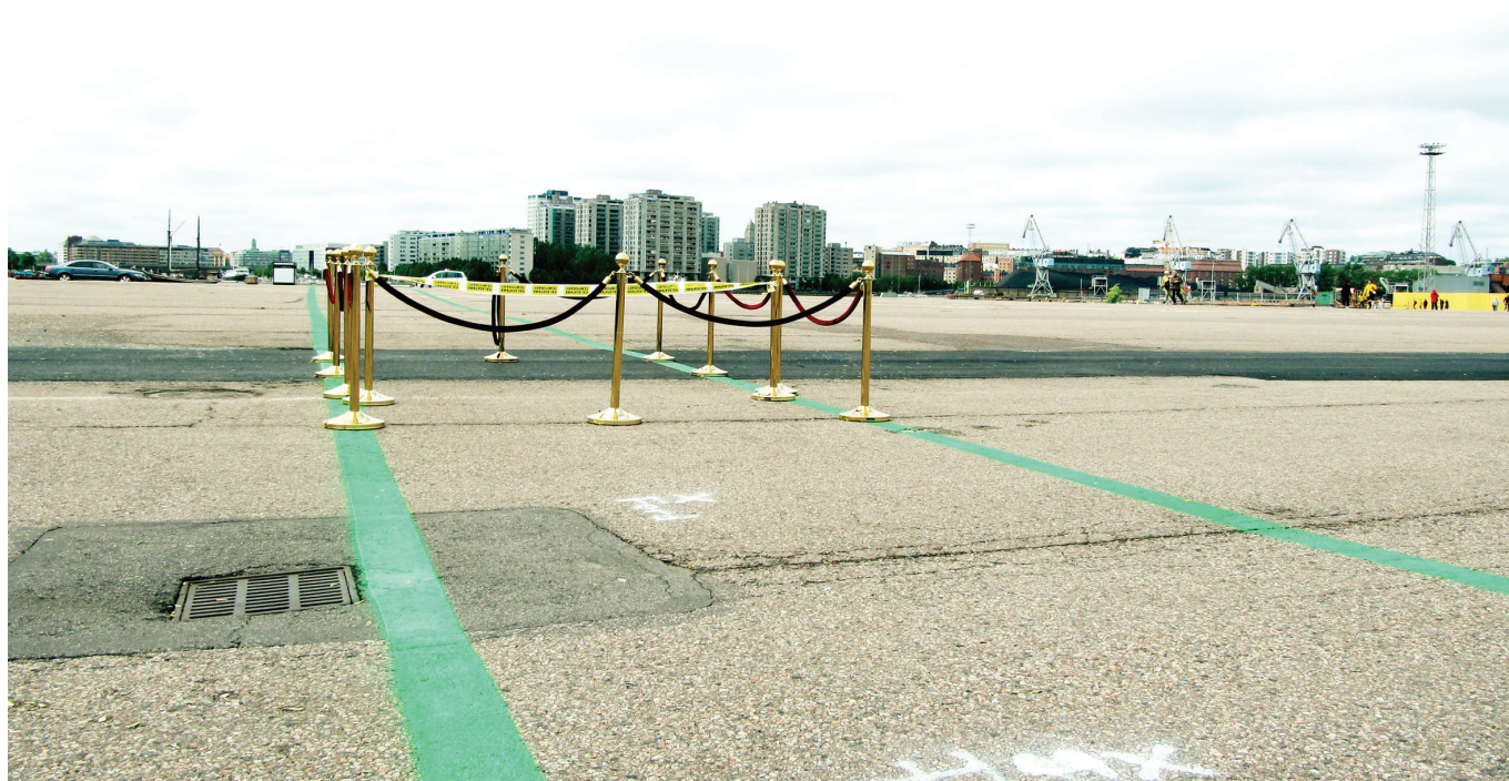
Kalasatama avamine.

kujunemisele ja oma elukeskkonnast huvitatud ja hooliva kodaniku 2 kasvami- sele“. Kõik kõlab küll idealistlikult, ent oluline on see, et nende lugude ja sekkumiste taga olevad inimesed julgevad unistada ning neid unistusi tänaval, parkides, hoovides, mere ääres või kus tahes teoks teha. Nii teevad elanikud linna avalikku ruumi enese omaks, Helsingi oma linnaks. Ja see omakorda loob aluse suuremateks süsteemseteks muutusteks.