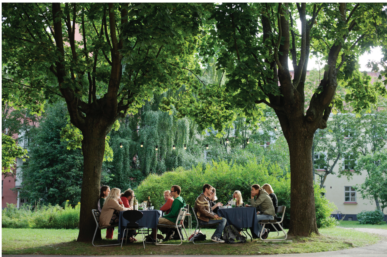
Restoranide päev. Restoran Kuchnya Polska.