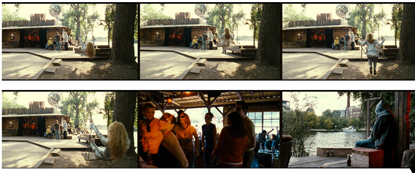
Bar25. Stseenid filmist „Berlin calling” (2008)

„Mediaspree verseken” väitis, et arengustrateegia pakuks teenuseid vaid väga piiratud inimgrupile ning tõukaks kõrvale piirkonna praegused kultuurilist väärtust loovad kasutajad. Aktivistid organiseerisid ka tänavapeo, mis tõi väärtused, mida kaitsta püüti, valju muusika ning tantsu saatel avalikku ruumi. Lühiajaliselt muudeti tänavad ajutisteks kultuuriareenideks.