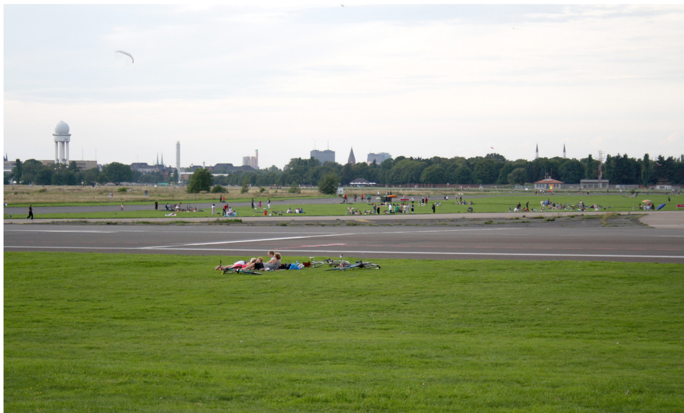
Tempelhoferi park 2010. aasta suvel