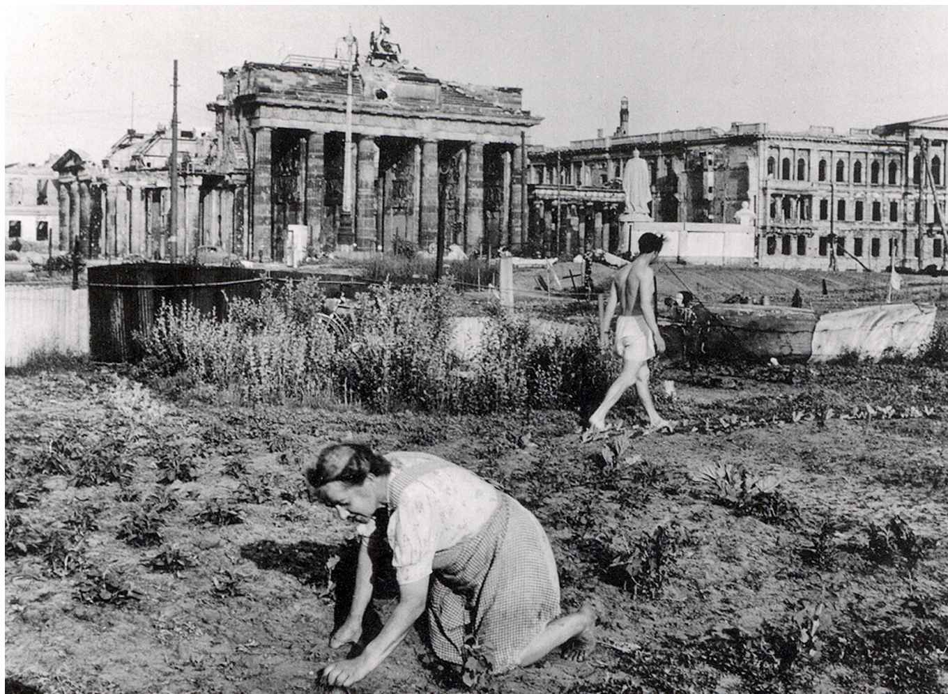
Juurviljaaed Brandenburgi värava juures, 1947. Postkaart