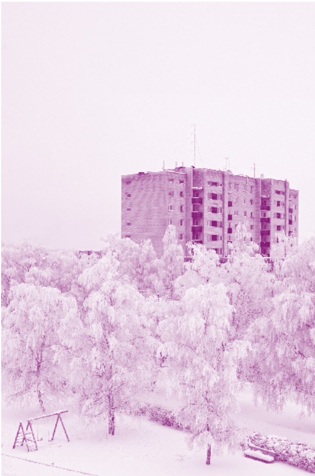
Viljandi, 2010. Damiano Cerrone

URBANISTIDE UUDISKIRI NR 3 DETSEMBER 2010