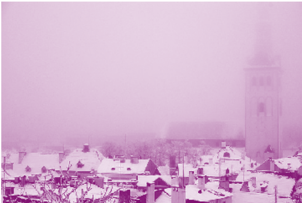
Tallinn, 2010. Damiano Cerrone