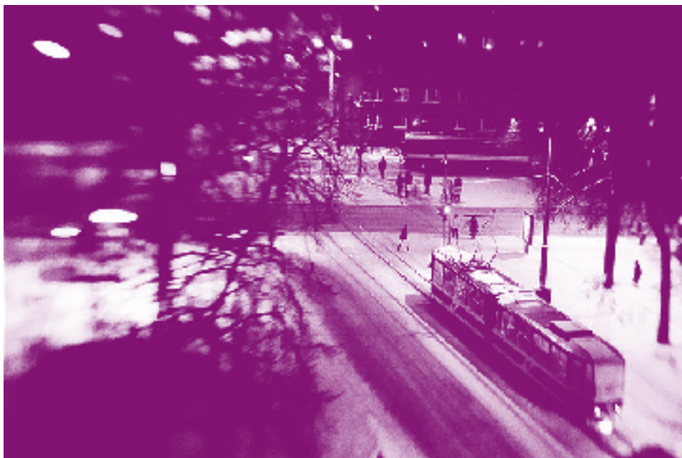
Tallinn, 2010. Damiano Cerrone