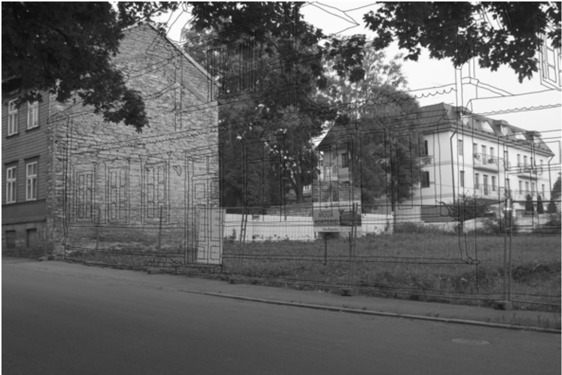
Seeria Holes/Wholes. Tõnu Tunnel