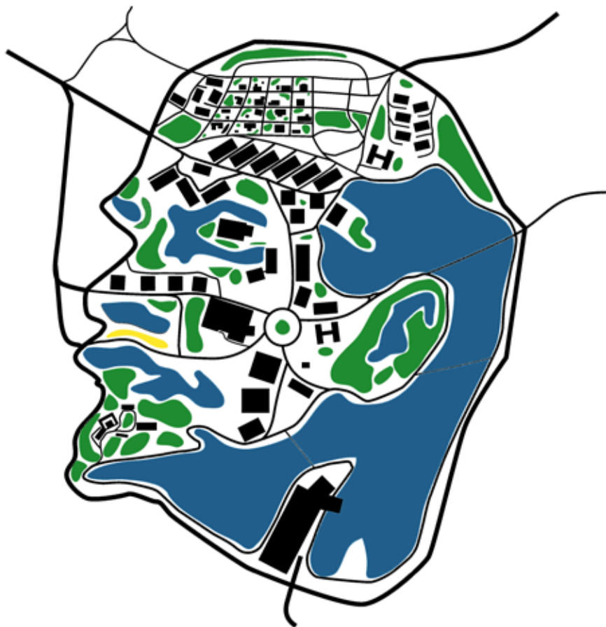
Sarjast Ideaallinnad . Tõnu Tunnel

Väike maaliseeria "Ideaallinnad" kätkeb endas utoopilisi arendusi linnaplaneerimise teemadel, võttes aluseks omal ajal auhinnatud ja maailmakuulsa Õismäe mikrorajooni ning mõned tolle aja ideoloogiliselt laetud ikoonilised isikud.